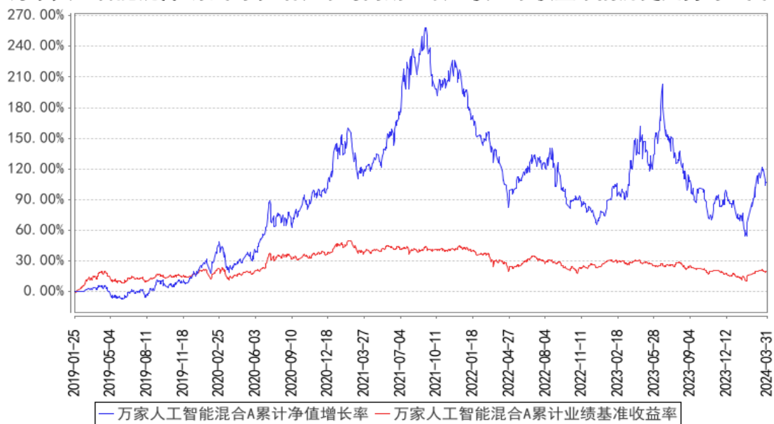
万家人工智能混合A累计净值增长率与同期业绩比较基准收益率的历史走势对比图