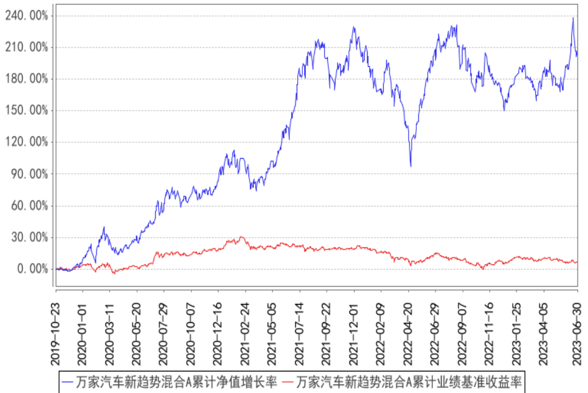
万家汽车新趋势混合A累计净值增长率与同期业绩比较基准收益率的历史走势对比图

2、自基金合同生效以来基金累计净值增长率变动及其与同期业绩比较基准收益率变动的比较