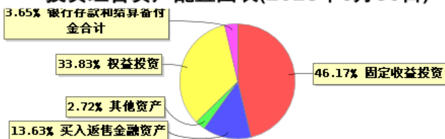
投资组合资产配置图表(2023年6月30日)

● 固定收益投资 ● 买入返售金融资产 ● 其他资产 ● 权益投资 ● 银行存款和结算备付金合计