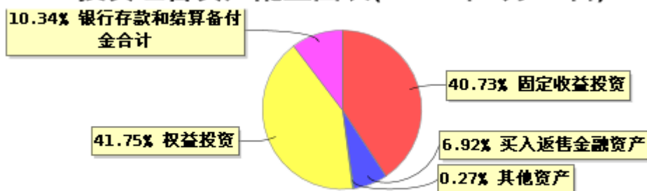
投资组合资产配置图表(2023年6月30日)