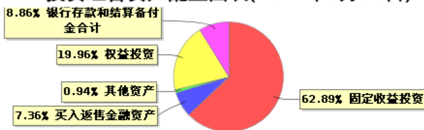
投资组合资产配置图表(2022年6月30日)

● 固定收益投资 ● 买入返售金融资产 ● 其他资产 ● 权益投资 ● 银行存款和结算备付金合计