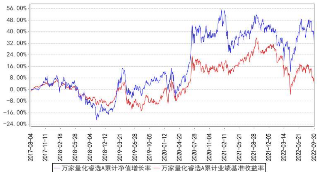
万家量化睿选A累计净值增长率与同期业绩比较基准收益率的历史走势对比图