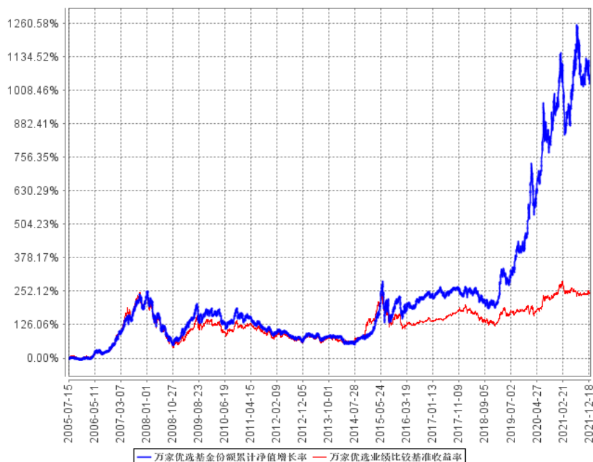
万家优选基金份额累计净值增长率与同期业绩比较基准收益率的历史走势对比图

注：本基金于 2013 年 7 月 11 日召开持有人大会，会议审议通过了《关于修改万家公用事业行业股票型证券投资基金（LOF）基金合同有关事项的议案》，该议案已于 2013 年 8 月 28 日通过并完成向中国证监会的备案。根据基金份额持有人大会决议，原“万家公用事业行业股票型证券投资基金（LOF）”更名为“万家行业优选股票型证券投资基金（LOF）”。更名后基金的建仓期为持有人大会决议生效日起 6 个月。建仓期结束时各项资产配置比例符合基金合同要求。2015 年 7 月 31 日，“万家行业优选股票型证券投资基金（LOF）”更名为“万家行业优选混合型证券投资基金（LOF）”。报告期末各项资产配置比例符合基金合同要求。