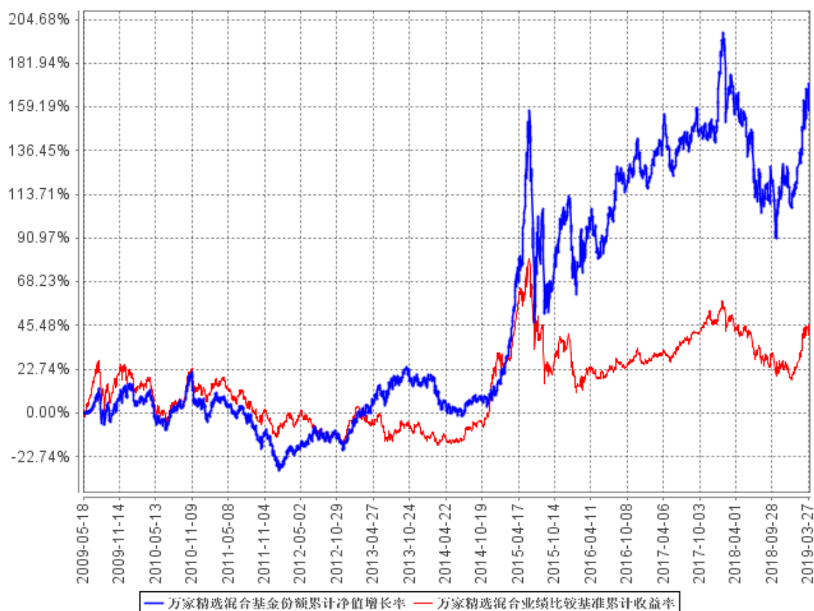
万家精选混合基金份额累计净值增长率与同期业绩比较基准收益率的历史走势对比图

注：本基金于2009年5月18日成立，根据基金合同规定，基金合同生效后六个月内为建仓期，建仓期结束时各项资产配置比例符合法律法规和基金合同要求。报告期末各项资产配置比例符合法律法规和基金合同要求。